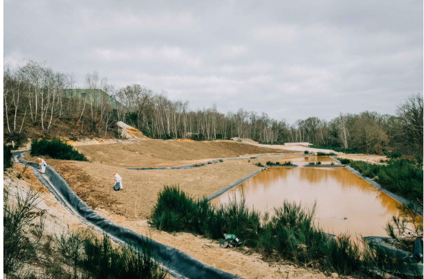
Lagune de décantation à St Pierre Montlimar en 2021 La mine d'or a cessé son activité en 1952