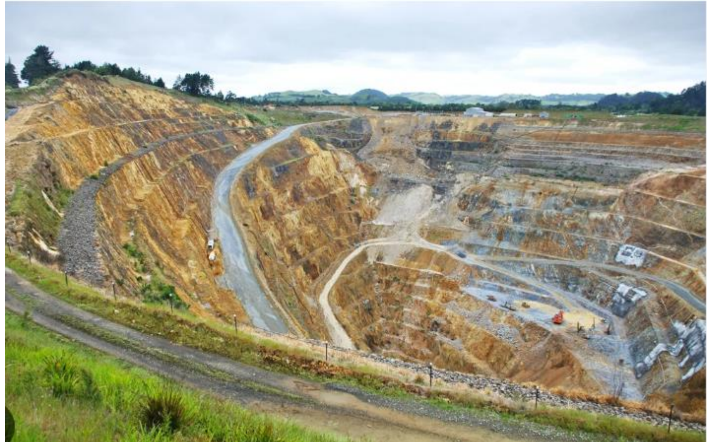
La mine d'or de Salsigne (Aude) en exploitation jusqu'en 2004